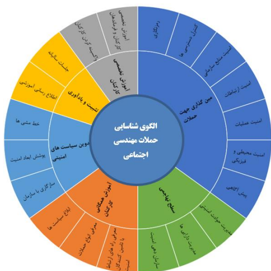
شکل ۳: الگوی شناسایی حملات مهندسی اجتماعی در سازمان‌های نظامی

کلید دفاع در برابر حملات مهندسی اجتماعی در آن است که بدانیم آسیب پذیری‌ها و تهدیدها چه چیزهایی هستند و سپس در برابر این ریسک‌ها به مقابله بپردازیم. دفاع باید چندین لایه حفاظتی داشته باشد، بطوریکه اگر هکری توانست از سطحی نفوذ کند، در لایه‌های دیگر به دام بیفتد از آنجایی که ثابت شده‌است حملات مهندسی اجتماعی بسیار موفقیت آمیز بوده‌اند، بنابراین داشتن راهبرد چند لایه‌ای در این زمینه حیاتی خواهد بود، در برخی نقاط نیز راهبرد بیشتر از دفاع باید در نظر گرفته شود. زیرا حمله کننده با حملات بسیار خود بالاخره سعی می‌کند تا نقاط ضعیف را شناسایی کند و بهمین دلیل است که سازمان باید در برابر حملات دفاعی محکم داشته باشد یا حداقل تشخیص دهد که مورد حمله قرار گرفته‌است.