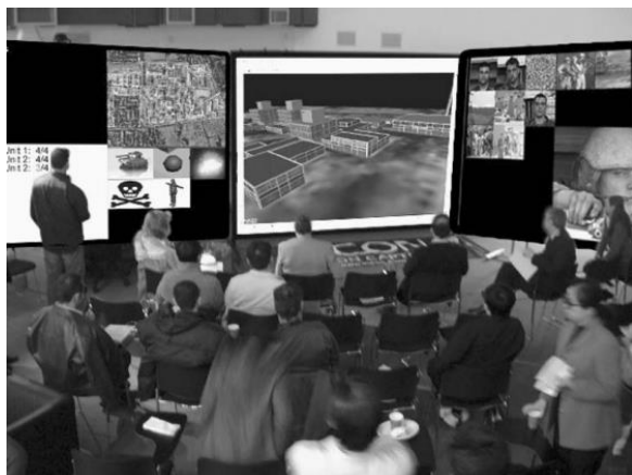
شکل ۲ مرکز فرماندهی کنترل مجازی پیاده سازی شده در دانشگاه برنول انگلستان [۱۴]

نظامی را توسعه داده و معرفی کردند که در آن فرماندهان می‌توانستند با یکدیگر و همچنین با میدان نبرد مجازی تعامل