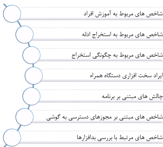
شکل 4. چارچوب مفهومی اولیه: دسته بندی مولفه های موثر در بررسی الزامات استنادپذیری ادله استخراجی از گوشی های تلفن همراه

همان گونه که قبلاً نیز بیان گردید، در مرحله دوم الگوی اولیه تکمیل و به عنوان پرسشنامه در اختیار خبرگان میانی قرار گرفت. پرسشنامه مورد استفاده شامل دو قسمت بوده که قسمت اول مربوط به سئوالات جمعیت شناختی خبرگان و قسمت دوم مربوط به سئوالات تحقیق می باشد که در ادامه هر یک تشریح می گردد.