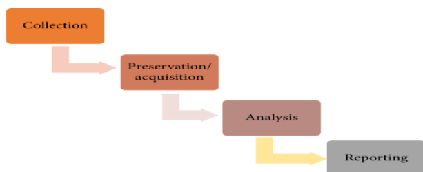
شکل 1) فرآیند تجزیه و تحلیل فارتزیک بر مبنای NIST [5]

مراحل استنادپذیری ادله دیجیتال برای جرائم و شواهد مختلف متفاوت می باشد ولی به صورت کلی می توان در 4 مرحله کلی بیان کرد: جمع آوری، استخراج، تجزیه و تحلیل و گزارش که در شکل 1 نیز نشان داده شده است (موسسه ملی استاندارد و فناوری (NIST) [5].